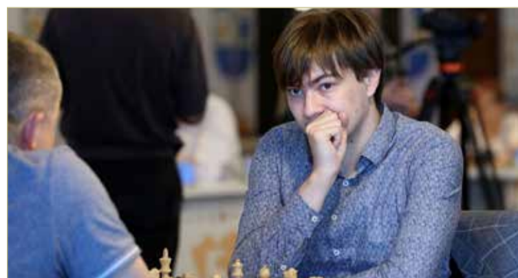
Новгородец продолжает борьбу в суперфинале.

В этой партии чёрные добились полноценной игры на выходе из дебюта, а в миттель-