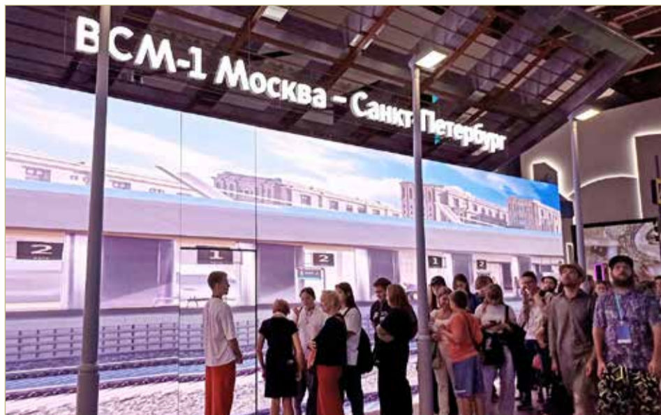
Очередь в виртуальный вагон не иссякает, благо, что движется скоро.