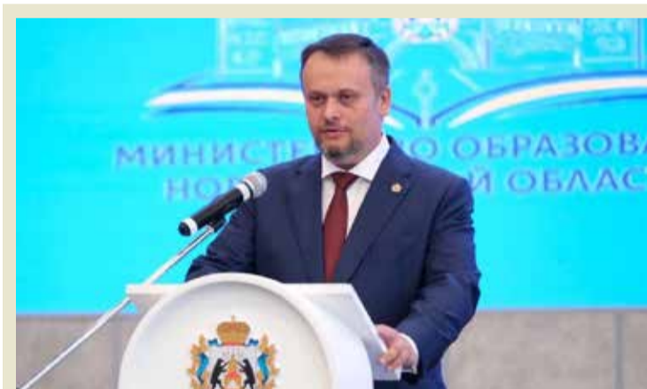
Андрей НИКИТИН, губернатор Новгородской области:

– В 2022 году Президент России поставил точку в многолетней дискуссии историков и политиков по поводу столицы Руси – Владимир Путин центром древнерусского государства назвал Великий Новгород. А что