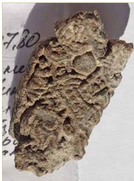
На свинцовой матрице для изготовления глиняных форм есть плетёный орнамент в северно-европейском стиле.

Волонтёр Валерия ОДИНЦОВА удивила знанием местной флоры: