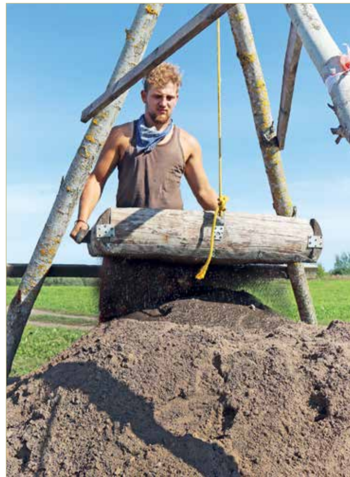
Чем отличаются исследователи Рюрикова городища от своих новгородских коллег? Они грохочут!

сформировавшийся взгляд на Рюриково городище как на административный и торговый центр, который в культурном отношении напоминает плавильный котёл: есть и скандинавский компонент, и славянский. Допустим, найденные в этом году фрагменты керамики X века относятся к образцам, характерным для Северо-Запада Руси.