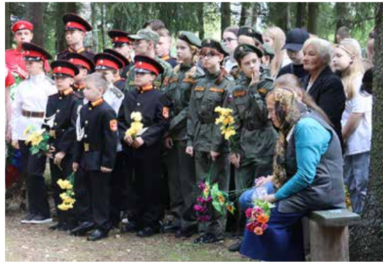
26 августа на воинском мемориале в Новоселицах с почестями похоронили останки девяти красноармейцев, поднятых юными поисковиками на неучтённом захоронении вблизи деревни Плашкино.