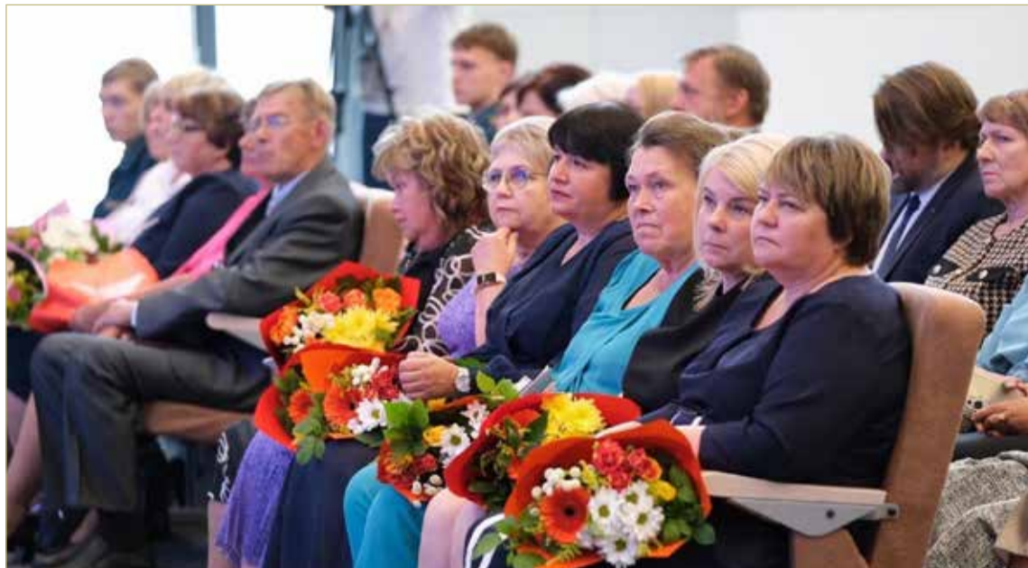
Лучшие учителя региона были награждены почётными грамотами и благодарственными письмами.