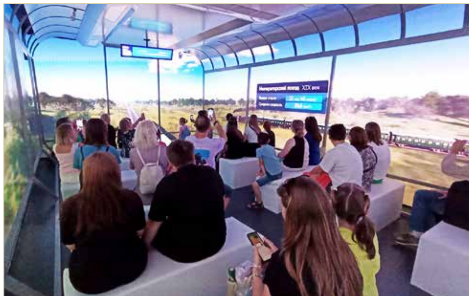
Внутри макета состава для ВСМ полным-полно справочной информации, чтобы дорога была интересной.